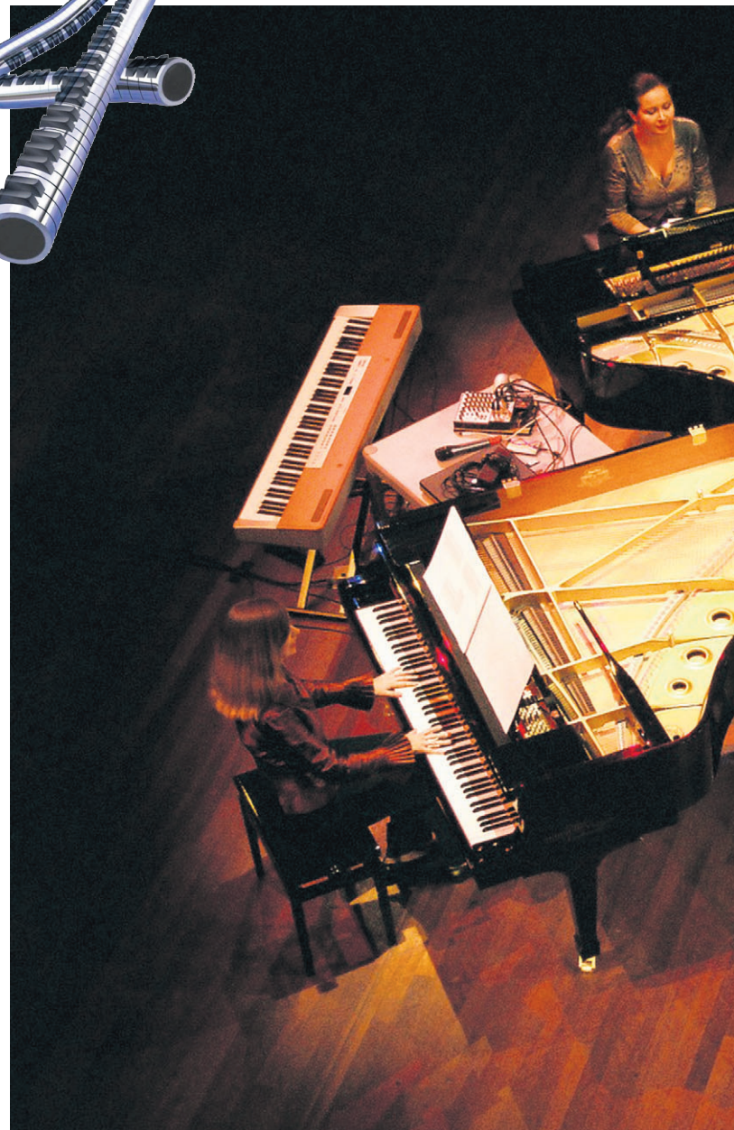
Het Piano Ensemble speelt werk van Simeon ten Holt en Mike Oldfield. Inzet:

Porgy en Bess. „Dit is een virtuoze uitvoering. Heel erg pianistisch bewerkt, met veel noten. Dat maakt het tot een spektakel, sprankelend en swingend.”